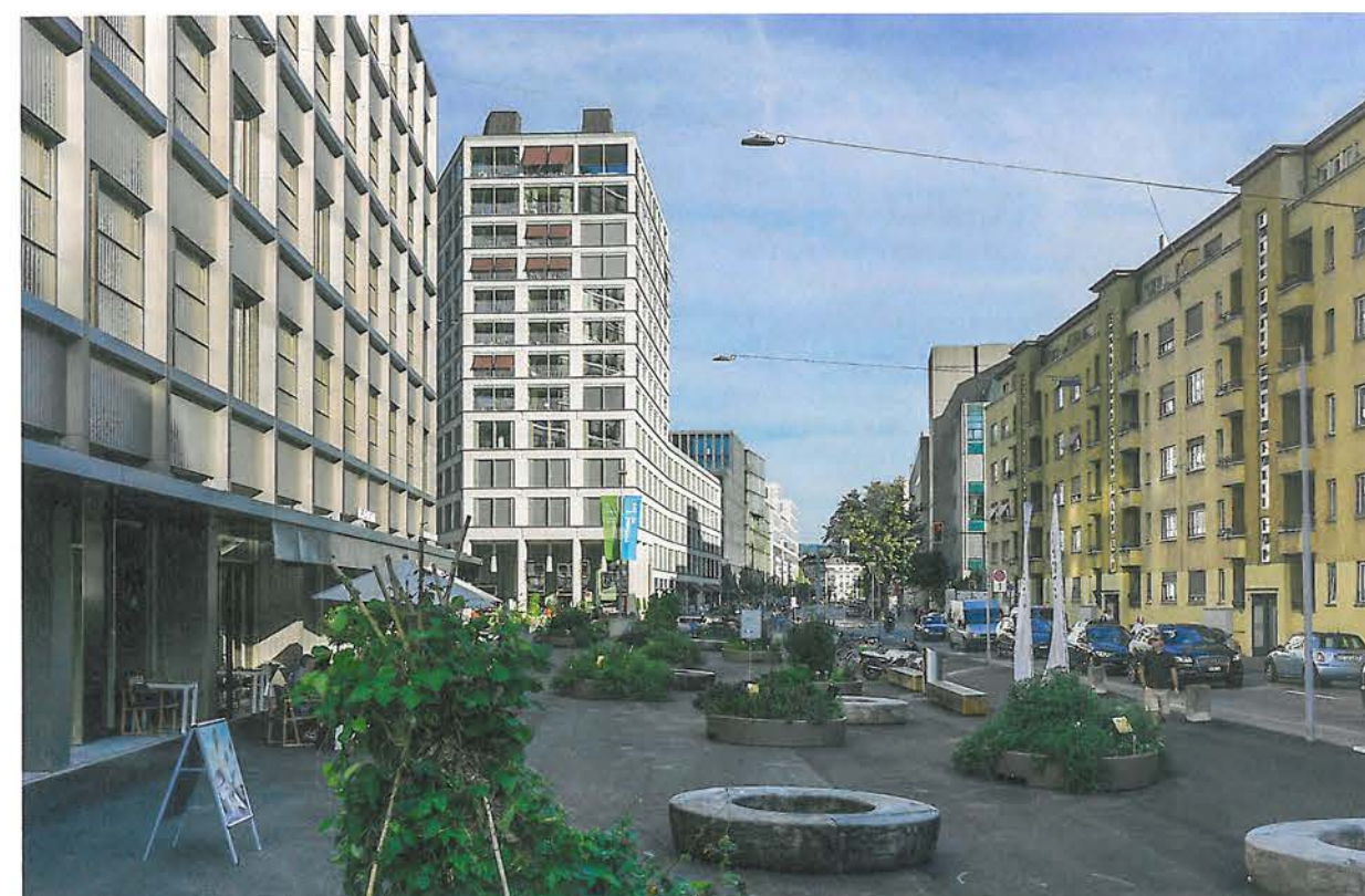
Es wird zitiert und referenziert in Zürich: Ist dies nun «retro» oder «analog»? Für die Architekten der mittleren Generation scheint die Frage müssig. Der historische Bezug ist kein kämpferisches Statement mehr.

All die erwähnten Positionen und Strömungen verbindet, dass sie Alternativen zu jener Konzeptarchitektur darstellen, die zur Schärfung eines Themas, sei