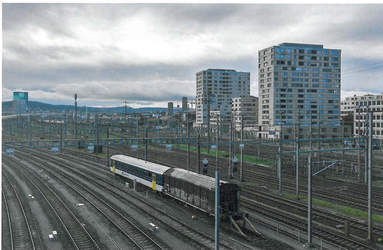
Adrian Streich Architekten und Loeliger Strub Architekten vereinen Ausdruck und Konstruktion in der Überbauung Letzibach am Gleisfeld in Zürich Altstetten. Ein Aufbruch zum Schweizer Neobrutalismus?

Gegen die Vorstellung, Konstruktion als «Umsetzung» eines Bilds oder eines Konzepts zu verstehen, richteten sich Ausstellung und Publikation «Dialog der Konstrukteure» 12 , deren ausserordentlicher Erfolg das entsprechende Interesse beweist. In dieselbe Richtung zielt in besonders offensichtlicher Weise das Konzept des «synchronen Entwerfens», das am Institut für Konstruktives Entwerfen IKE der ZHAW Winterthur unter der Federführung von Astrid Stauffer und Beat Waeber vor über zehn Jahren eingeführt und weiterentwickelt wurde. 13 Die materielle Realität des Bauens wird hier radikal und von Anfang an im Entwurfsprozess mitgedacht, mit dem Ziel, das Ausdruckspotenzial der Konstruktion möglichst gut zu nutzen und so eine verständliche, ausdrucksstarke und gleichzeitig effiziente und zeitgemässe Baukunst zu erreichen.