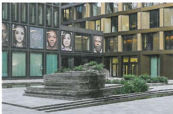
Von oben nach unten: Maximale Abstraktion bei EM2N am Wohnhaus an der Frankengasse. Mit diesem Gebäude scheint ein Höchstmass an Konzeption erreicht. Walmdächer auf Hochhäusern: An der Europaallee klingt die Formensuche der «Analogen» nach. Gleichwohl stehen daneben Leuchttürme der Neo-Modernen. Mit der aufgelösten Glasfassade von Gigon/Guyer und der angedeuteten tektonischen Gliederung von David Chipperfield treffen sich Meister der gepflegten Abstraktion.

tur ist ohne Referenz auf ein konventionelles System schlechterdings undenkbar. Ein solches Streben ist nun aber heute an vielen Orten und in unterschiedlichen Strömungen zu erkennen. Es ist das Bemühen, die Architektur von den Spielwiesen der Meta-Architektur, der Iconic Architecture und des Starsystems wieder zu den «Essentials» zurückzuführen und sie auf einen «Common Ground» zu stellen – so kann sie wieder in das Zentrum der Stadt zurückkehren, statt bloss als Exotin an der Peripherie ihr Dasein zu fristen.